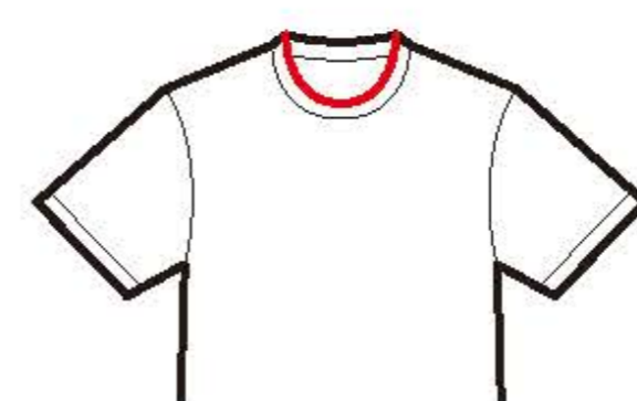
ラウンド ネックシャツ