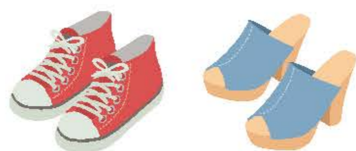
スニーカー・サンダル