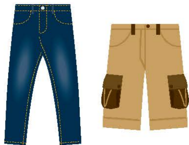
ジーンズ・カーゴパンツ