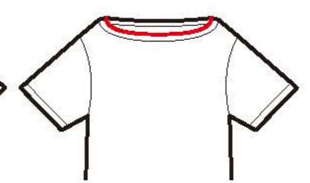
ボート ネックシャツ