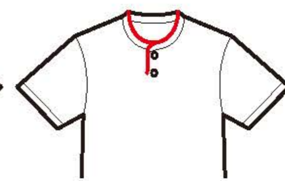
ヘンリー ネックシャツ