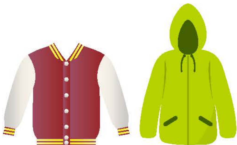
ブルゾン・ジャンパー